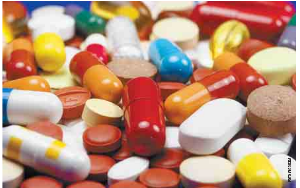
Trotz verstärkten Einsatzes von Generika steigen die Kosten für Medikamente in der Schweiz und Liechtenstein.