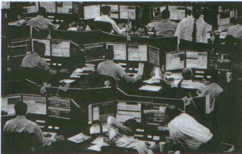
Auch solide Unternehmen und Banken sind darauf angewiesen, kurzfristig Kredite aufnehmen zu können. Das taten sie jahrzehntelang problemlos am sogenannten Geldmarkt, der als absolut sicher galt. Als Folge der Hypothekarkrise verloren Leute am Geldmarkt aber plötzlich Geld. Im September 2008 froh der Markt ein: Niemand mehr wollte sein Geld leihen.

Ein Geldmarktfonds ist im Grunde einfach eine Art Sparkonto. Es ist gar nicht so unwahrscheinlich, dass Sie selbst an einem beteiligt sind. In normalen Zeiten ist es einer der sichersten Orte, an denen man sein Geld aufbewahren kann. Sie zahlen 1000 Dollar ein und wissen, dass Sie auf jeden Fall Ihre 1000 Dollar zurückerhalten. Vielleicht sogar 1010. Und Sie geben sich mit dieser dürftigen Rendite zufrieden, weil sie wissen, dass Ihr Geld dort sicher ist.